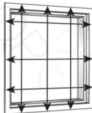
Op de dag

De maatvoering welke u opgeeft is de productmaat(blijvende maat)inclusief bovenbak en onderlat.